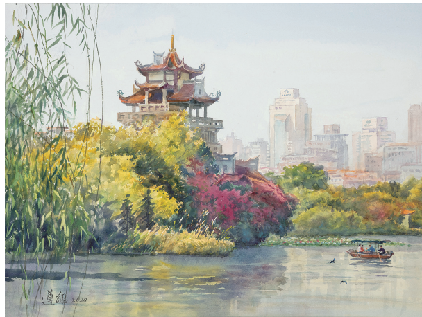
东湖公园(纸本水彩)

己的探索和展示,无论是题材还是手法,都体现了水彩画的专业性、艺术性以及画家的创新性。画家